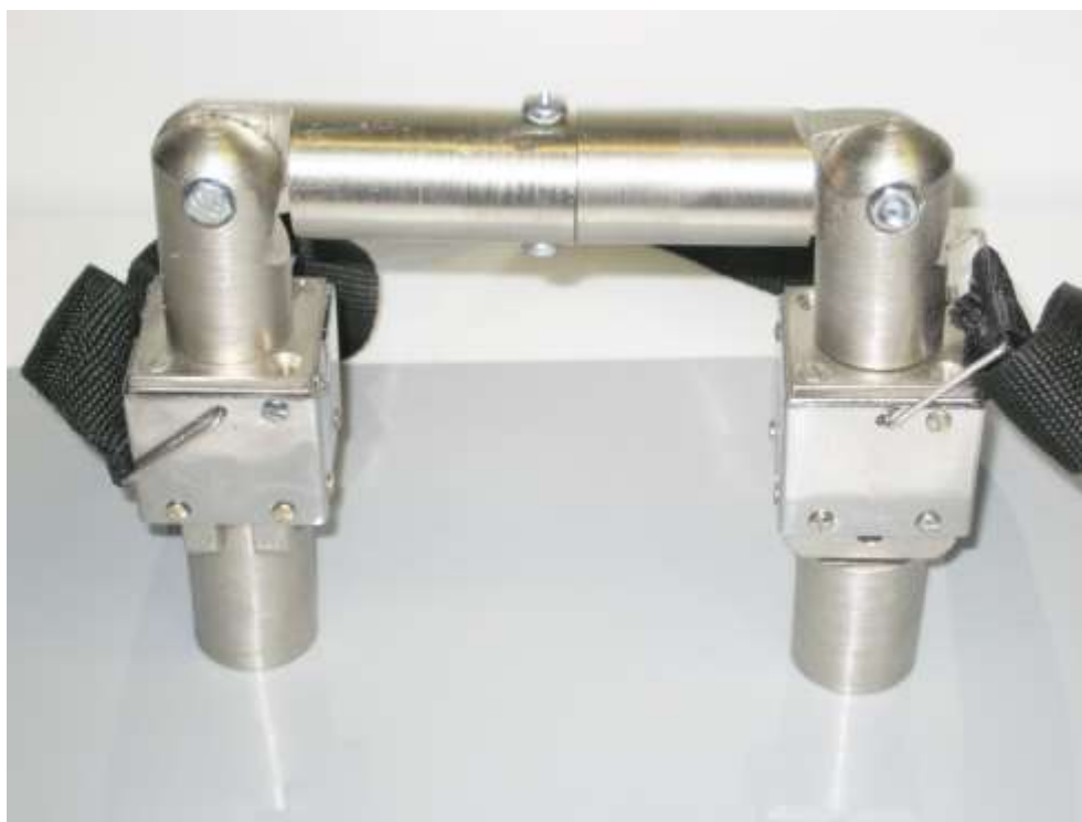
Рис.4. Намагничивающие блоки, соединенные шарнирным магнитопроводом, на проверяемой детали.