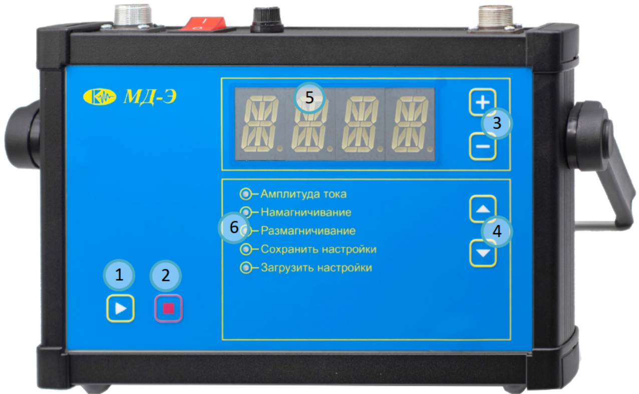
РИС. 4.3А ПЕРЕДНЯЯ ПАНЕЛЬ МОДУЛЯ МД-Э:

1 - КНОПКА «ПУСК»; 2 - КНОПКА «СТОП»; 3 - «+», «-» УВЕЛИЧЕНИЕ И УМЕНЬШЕНИЕ ТОКА; 4 - КНОПКА ВЫБОРА ПУНКТОВ МЕНЮ; 5 - ЦИФРОВОЙ ИНДИКАТОР; 6 - МЕНЮ.