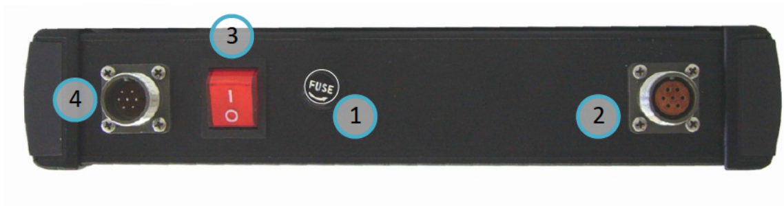
РИСУНОК 4.3Б ВЕРХНЯЯ ПАНЕЛЬ МОДУЛЯ МД-Э:

1 - КНОПКА «ПУСК»; 2 - КНОПКА «СТОП»; 3 - «+», «-» УВЕЛИЧЕНИЕ И УМЕНЬШЕНИЕ ТОКА; 4 - КНОПКА ВЫБОРА ПУНКТОВ МЕНЮ; 5 - ЦИФРОВОЙ ИНДИКАТОР; 6 - МЕНЮ.