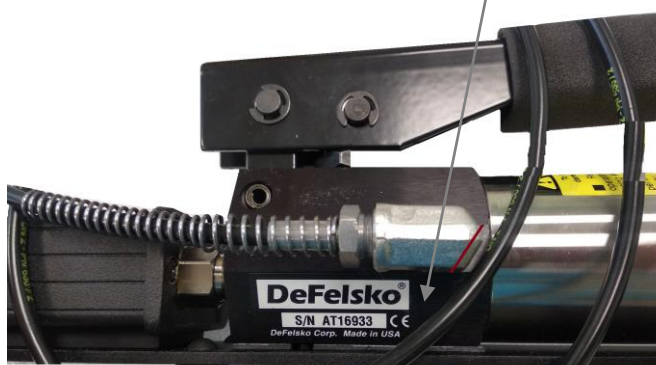
Рисунок 2 - Общий вид адгезиметра гидравлического DeFelsko PosiTest AT-M