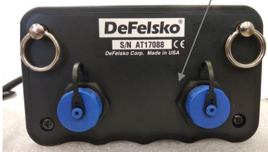
Рисунок 1 - Общий вид адгезиметра гидравлического DeFelsko PosiTest AT-A